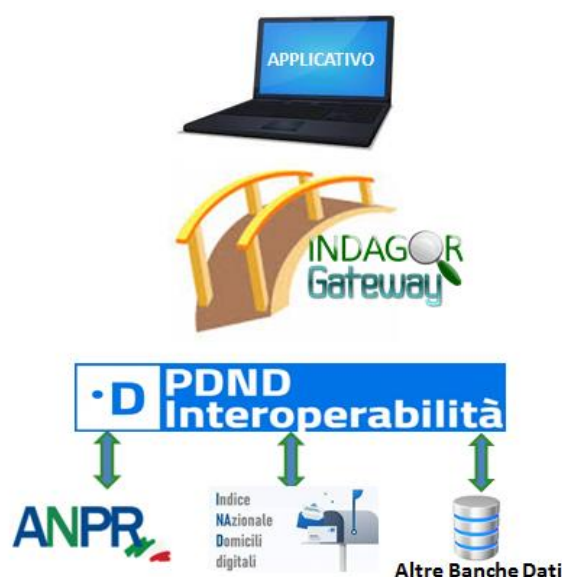
Figura 1: Rappresentazione del ruolo di INDAGOR Gateway

INDAGOR Gateway consente in sintesi di non destinare risorse allo studio, realizzazione, manutenzione ed aggiornamento – per ogni applicativo da integrare con la PDND - dell'infrastruttura tecnica necessaria ai processi di interoperabilità con gli enti erogatori attestati sulla PDND e dei servizi di tracciabilità e monitoraggio delle interrogazioni effettuate.