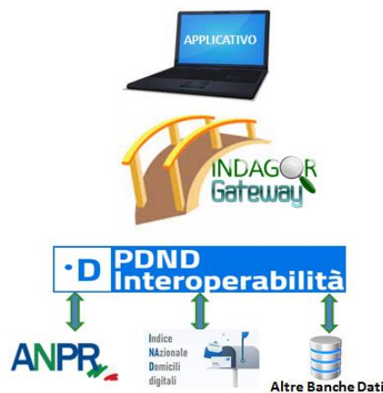
Figura 1: Rappresentazione del ruolo di INDAGOR Gateway

INDAGOR Gateway consente ai produttori di software di non destinare risorse allo studio, realizzazione, manutenzione ed aggiornamento sia dell'infrastruttura applicativa necessaria ai processi di interoperabilità con gli enti erogatori attestati sulla PDND, sia dell'infrastruttura applicativa necessaria ai servizi di tracciabilità e monitoraggio delle interrogazioni effettuate.